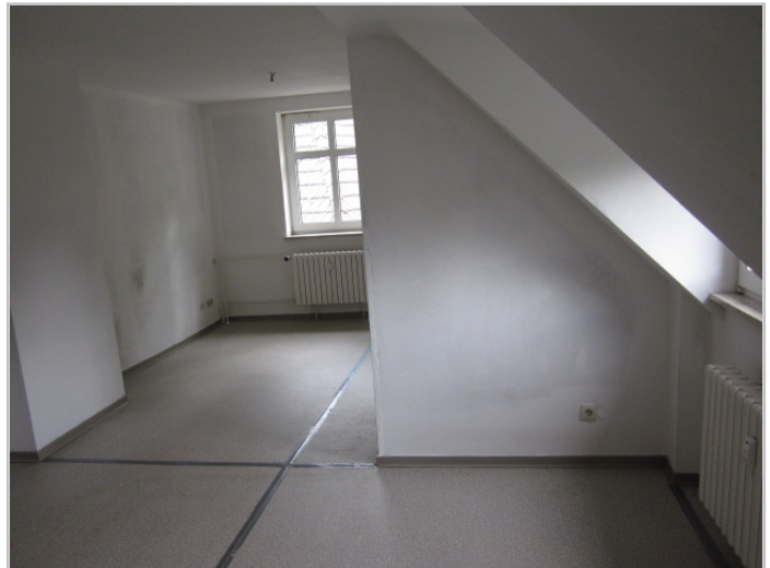
Wohnzimmer Bild 1